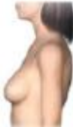
M5 (mama adulta)